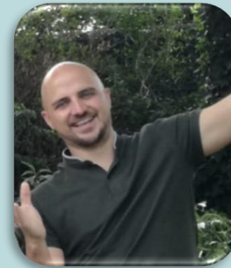
Meester Giovanni Turnmeester kleuters Aanwezig op woensdag, donderdag en vrijdag

24 Jaar Houdt van reizen, wandelen en ijsjes